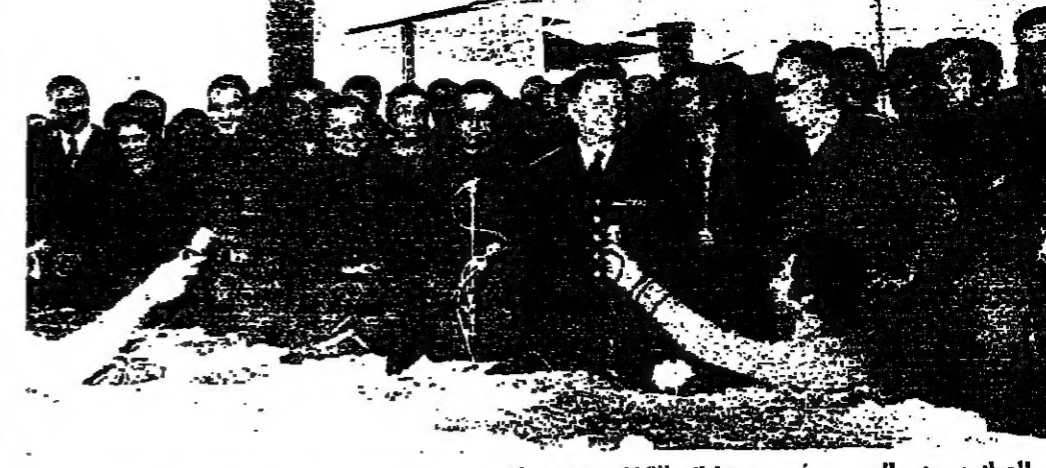
المعاد حنا سعيد بلقي كلبنة